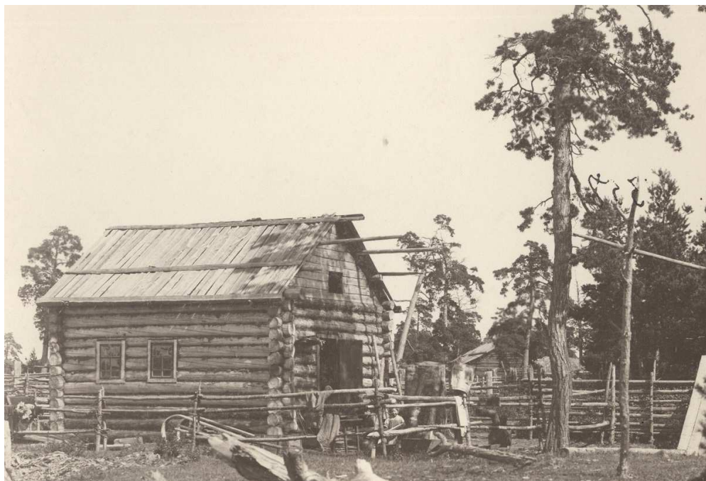
Рис. 4. Юрта вогула с. Нахрачинское. Фото В.Н. Пигнатти (1910 г.). ТИАМЗ, ФотофондТМ-15519/40.

статуса»остававшихся за«оседлыми» земель снимало ограничения для пересмотра норм наделения соответствующей части инородцев различными угодьями. Это позволяло распространить на них нормы принятые для государственных крестьян в Сибири, что означало бы реальное сокращение земельных площадей у автохтонного населения. На рубеже XIX–XX вв.так и будет сделано, например, в ряде уездов Тобольской губернии.Показательно, что волостные сходы крестьян Туринского уезда ещё в 1889 г. выступали за причисление к ним оседло живущих вогул на условиях уравнивания в землепользовании с инородцами за счет последних 1 .