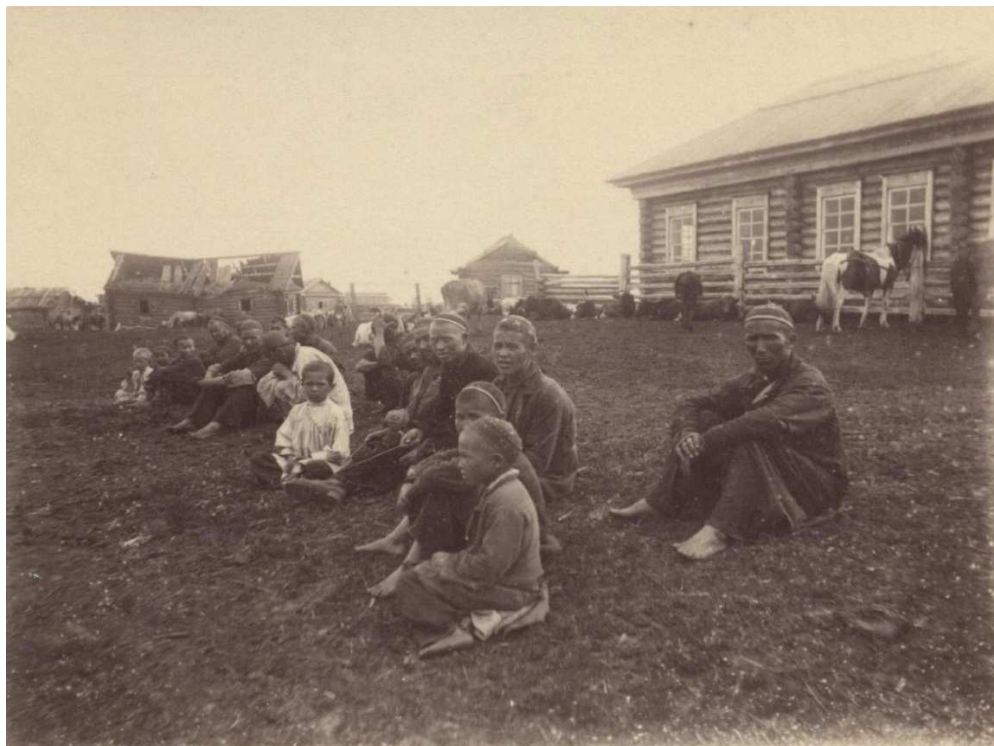
Рис. 3. Группа татар Тобольского уезда. Начало XX в.

и с точки зрения тех же крестьян, местной и центральной администрации. Не будет преувеличением сказать: для того чтобы превратить инородца в государственного крестьянина, надо было сделать его до известной степени русским.